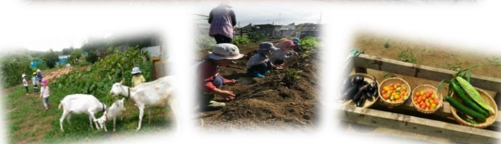
野菜のお世話や収穫体験をします